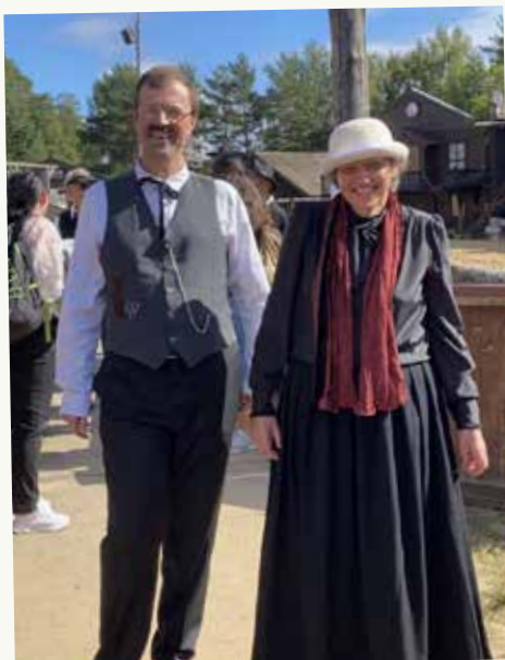
Bilder fra High Chaperal, der Megatown ble spilt inn høsten 2022.