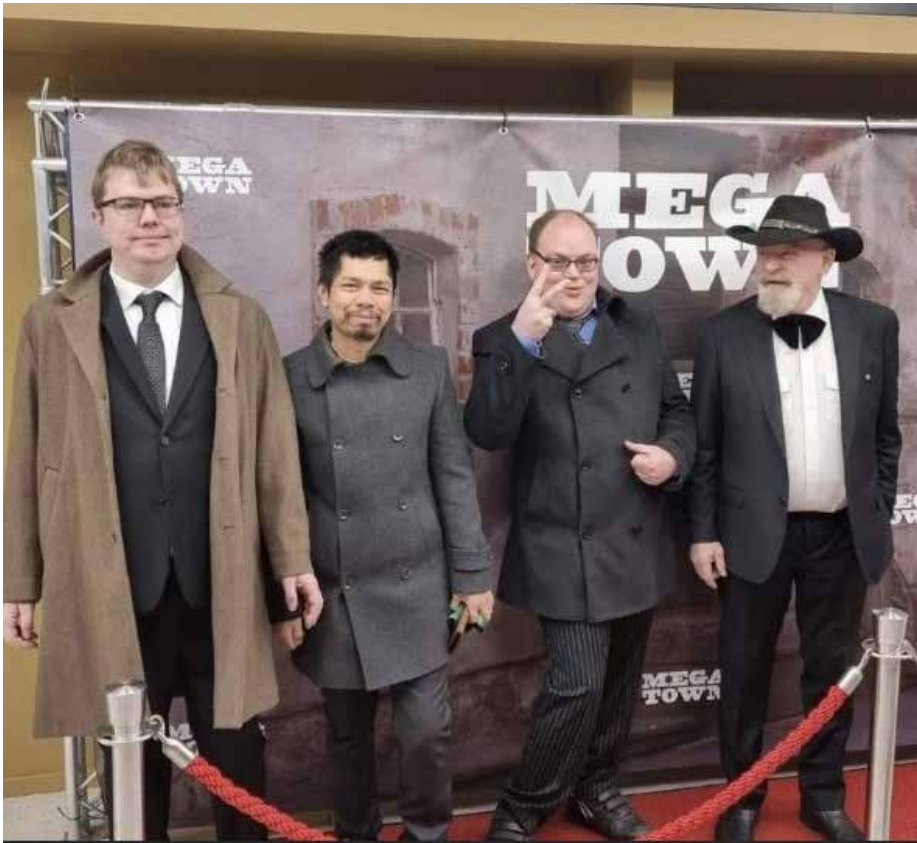
Fra premieren til Megatown i Drammen kino 19. mai.