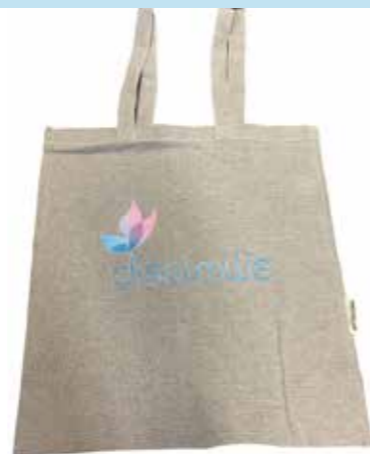
Handlenett kr. 100