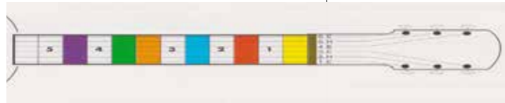
Slik ser fargene ut på gitarhalsen.

bassen, noe den gjør dersom man bruker den mørkeste strengen på gitaren. Hvis du bruker kun én streng på gitaren anbefaler vi at du beholder D-strengen, men stemmer den opp til en E. På den måten holder du deg i mellomregisteret. Etter hvert som elevens tekniske ferdigheter øker, kan man avansere til å bruke flere strenger.