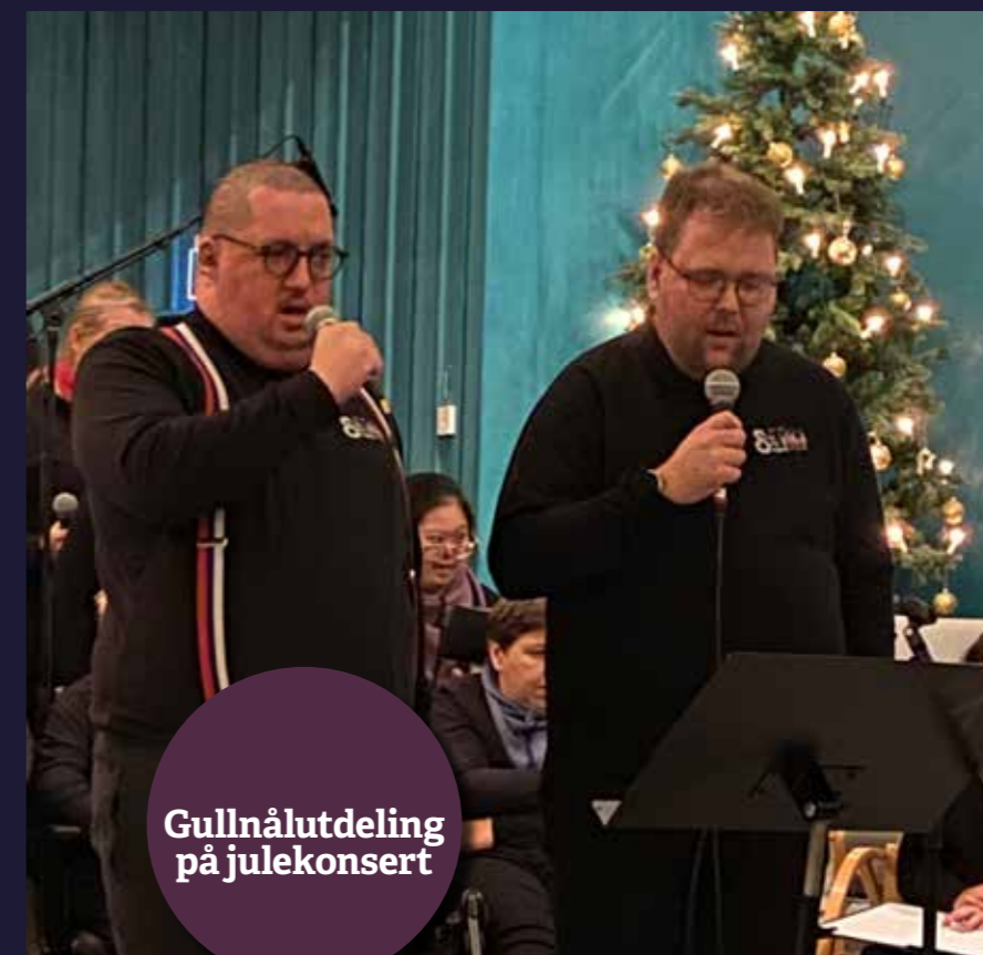
Gullnålutdeling på julekonsert