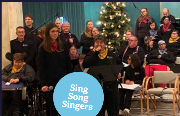
Sing Song Singers