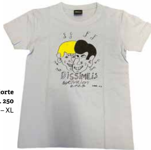
Festival T-skjorte KR. 250