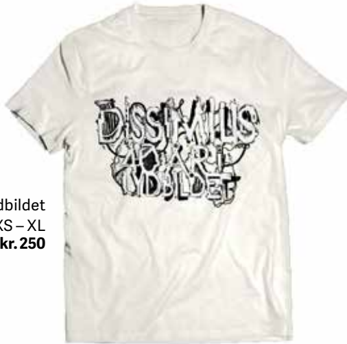
40 år i lydbildet Fåes i sort eller hvit, str. XS – XL Jubileumstrøye kr. 250