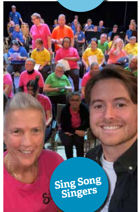
Sing Song Singers