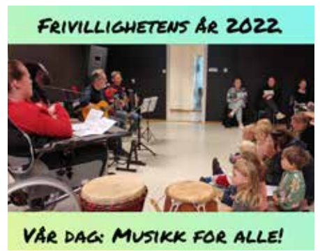
FRIVILLIGHETENS ÅR 2022