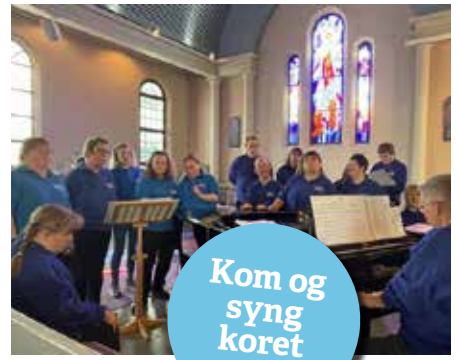
Kom og syng koret