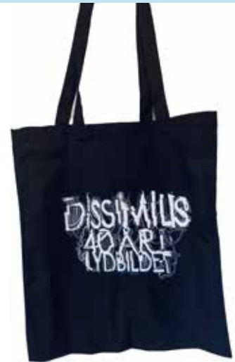
Handlenett med jubileumslogo kr. 100